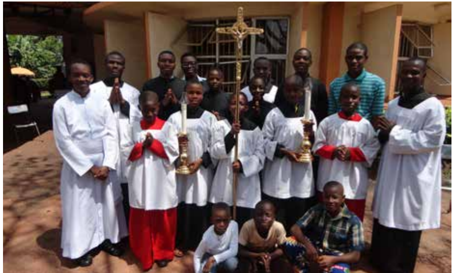
Les servants de messe