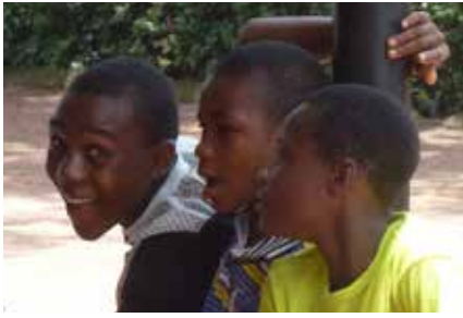
Toujours le sourire