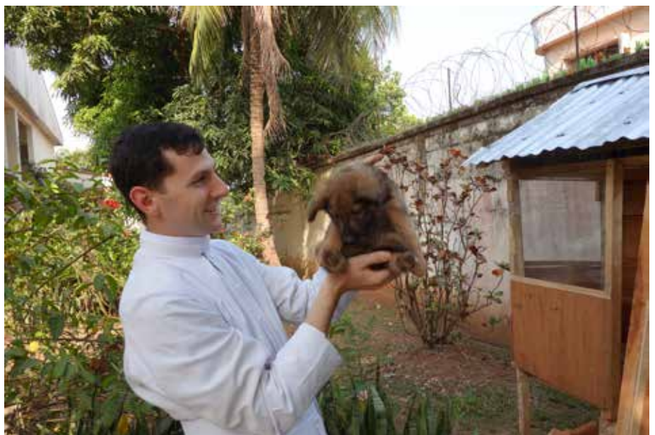
«Ecce», cadeau d'un fidèle

Nous sommes là pour leur apporter ce dont ils ont besoin. Verra-t-on affluer les foules? Il est encore trop tôt pour le prédire! L'avenir seul nous le dira... Mais les brebis ont faim, il s'agit de les mener sur les verts pâturages du Maître. Fais ce que dois, et advienne que pourra!