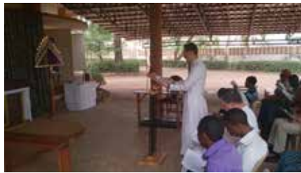
Chant des ténèbres le Samedi Saint

Après avoir étudié plus de 80 propositions, toute notre attention se porte actuellement sur l'acquisition d'un terrain qui semble vraiment intéressant: assez calme, accessible, suffisamment grand et d'un prix encore raisonnable. Mais en attendant, nous devons finir l'extension du toit de la chapelle provisoire si le propriétaire ne s'y oppose pas; acheter des chaises supplémentaires, celles acquises