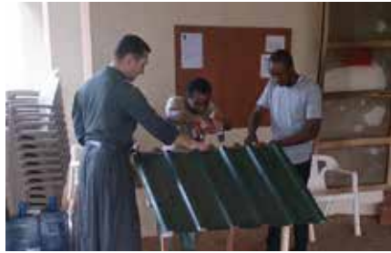
Construction de la niche d'Ecce par les pré-séminaristes

récemment étant désormais en nombre insuffisant; acheter un bon microphone pour les cérémonies en extérieur ; organiser un week-end de formation pour nos catéchistes de tout le Nigeria ; refaire le bureau de permanence du prêtre; acheter quelques livres de Grégorien pour la chorale et des livres de formation pour nos postulants séminaristes. Enfin, il nous faut compléter la sacristie avec quelques ornements.