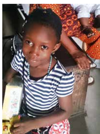
Une petite fidèle de Lagos