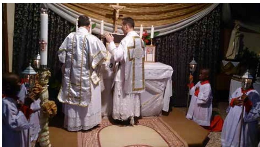
La messe à Enugu