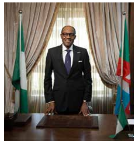
Muhammadu Buhari, président du Nigeria depuis le 28 mars 2015

Son mandat débute dans un contexte chargé : depuis le 19 avril, l'armée tchadienne et la secte islamiste s'affrontent à la frontière entre Nigeria et Cameroun, sur un territoire urbain stratégique. Un défi militaire, politique et religieux, à l'image de celui qui attend Muhammadu Buhari.