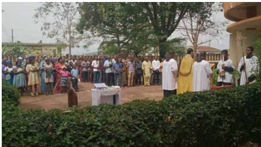
Bénédictio des rameaux