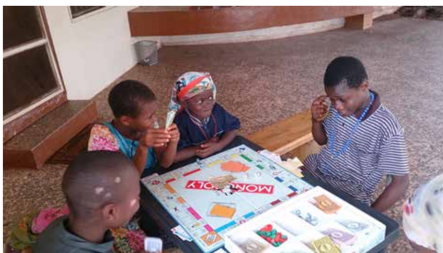
Après le catéchisme, les jeux