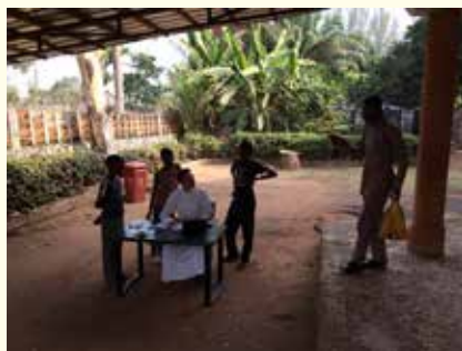
Accueil des enfants du catéchisme