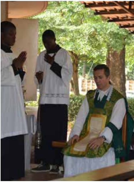
Messe à Enugu ▲