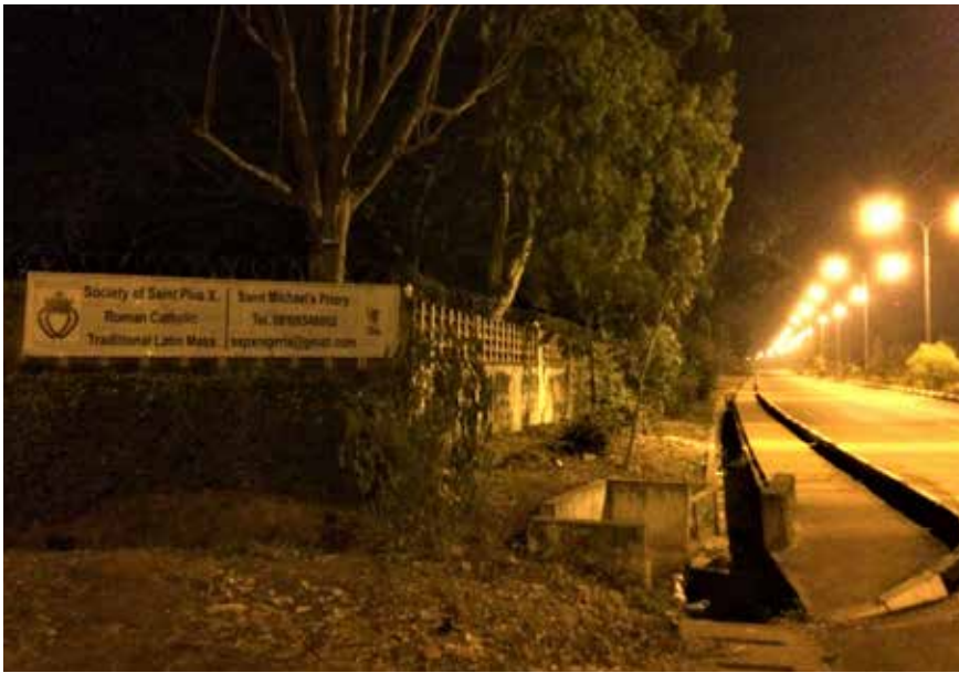
Umuawulu street ▲

A Okigwe, Michael laisse le bus. Il préfère garder ses économies pour la traversée de la grande mer au Nord. Alors il se débrouillera autrement jusqu'au Niger. La route est longue, c'est vrai. Des jours, des semaines de marche, de kilomètres parcourus accroché au marchepied d'un camion surchargé, se tenant avec ses mains, s'efforçant à ne pas tomber.