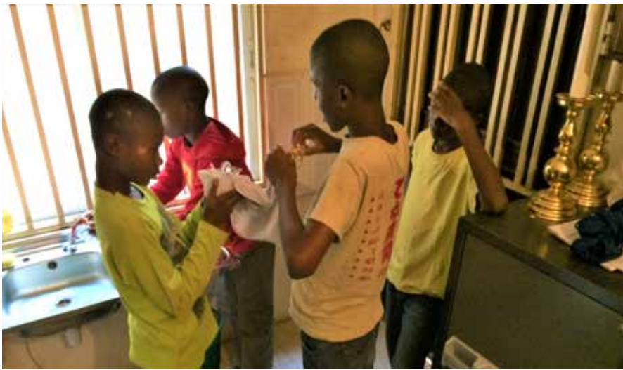
Les enfants de chœur ▲