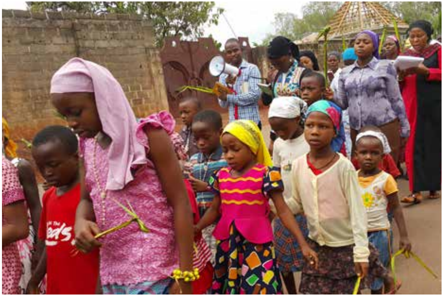
Procession à Enugu ▲