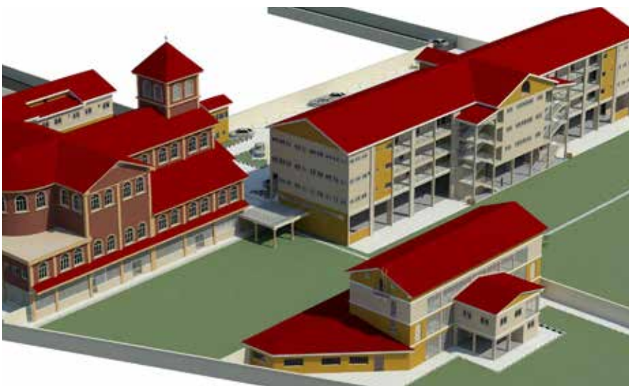
Futures constructions de la Mission Saint Michel