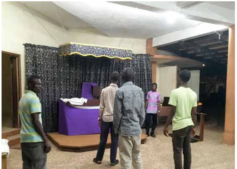
Cours de catéchisme pour les jeunes ▼